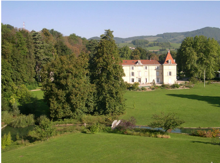
Parc de la Brunerie